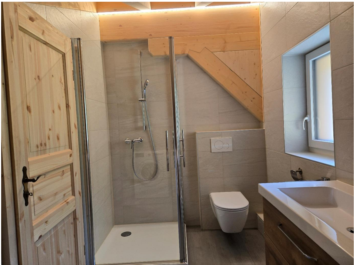
WC douches aux combles