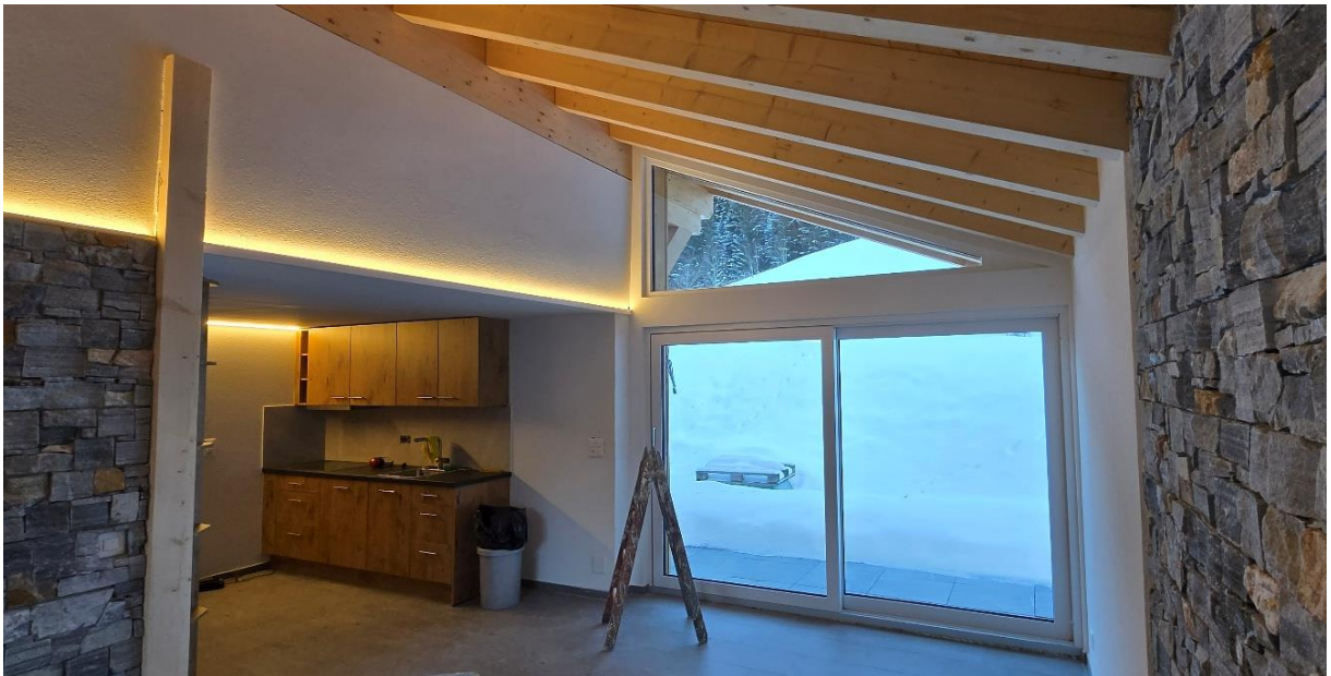
Cuisine salle à manger