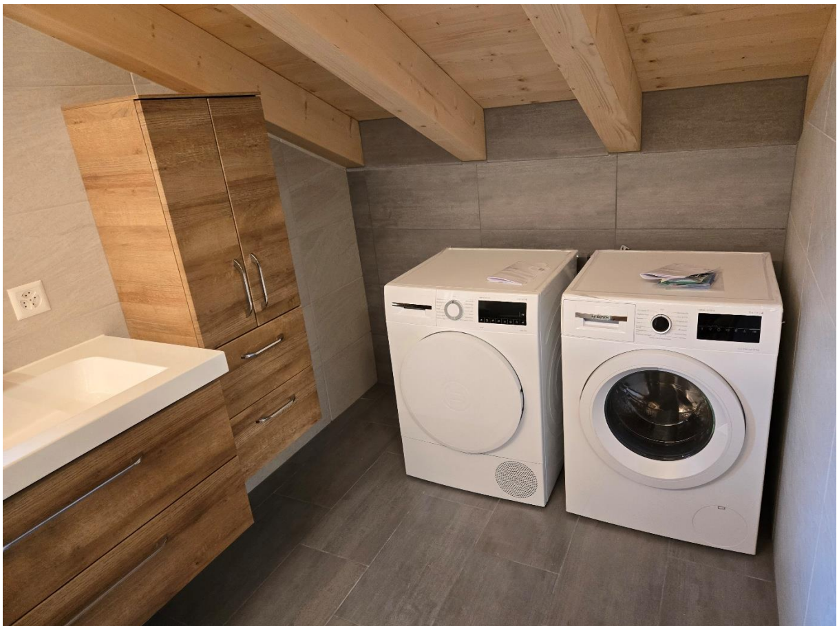
Buanderie aux combles