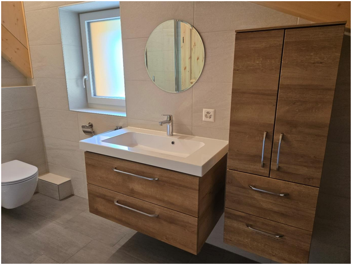
WC douches aux combles