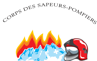
CSP Dents du Midi

L'état-major du CSP DDM est composé d'un commandant, d'un officier permanent à 100% et de trois chefs de détachement, soit un par village.